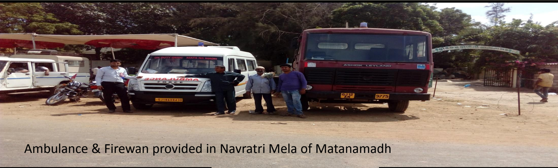
Ambulance & Firewan provided in Navratri Mela of Matanamadh