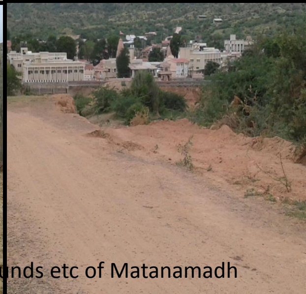
Babul Cutting, Road resurfacing, Cleaning of Grounds etc of Matanamadh