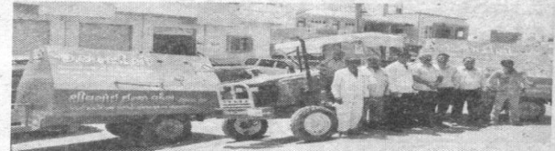
ટ્રેક્ટર સહિતની ટ્રોલી આપી રહેલા GMDCના કર્મચારીઓ નજરે પડે છે.